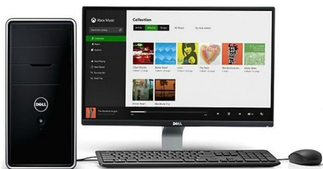
Model: M869 Bảo hành 2 năm