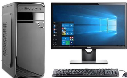
Model: M822 Bảo hành 2 năm