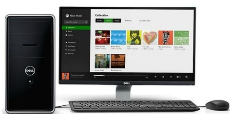
Model: M867 Bảo hành 2 năm