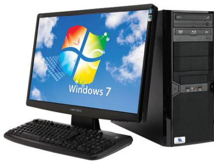
Model: M820 Bảo hành 2 năm