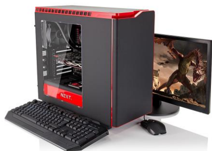
Model: M866 Bảo hành 2 năm